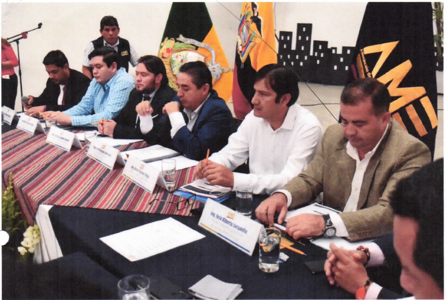
REUNION AME - LIMÓN INDANZA.