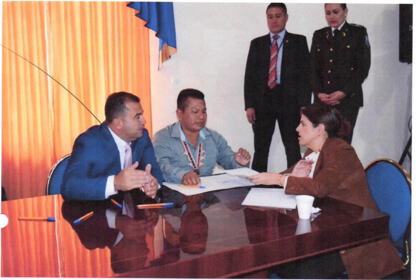
REUNION MINISTRA DE GOBIERNO - QUITO